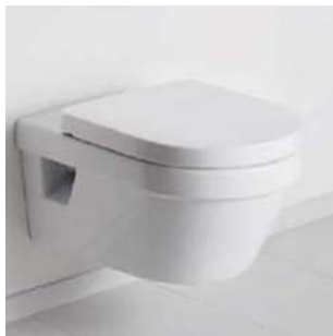
Inodoro suspendido Combi-pack Targa de V&B con cisterna oculta.