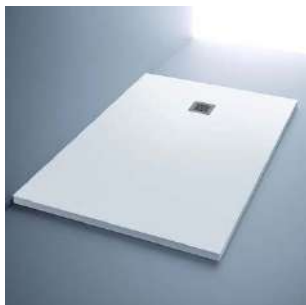
Platos de ducha extraplano con mampara en aseo y baño (Opción de colocar bañera).

Mueble con encimera de porcelana y grifería Hotels de Noken, en baño y aseo.